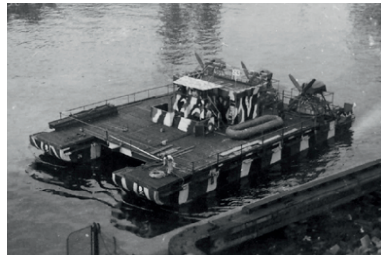
De SF 24 was een van de eerste uitvoeringen van de Soko Fähre type 40F

In april 1941 verplaatste Soko Siebel , een vijftal Fähren , monteurs en enkele werkplaatsspecialisten naar Constanza in Roemenië. De verplaatsing gold ter voorbereiding voor ondersteuning in de Zwarte Zee tijdens Operatie Barbarossa, de Duitse inval in de Sovjet Unie. Dit zou als Lufwaffen-Fährenflotille I worden ingezet in hoofdzaak voor transporten