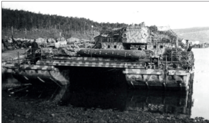
Een gecamoufleerde Siebel Fähre op het Ladoga Meer.

in de noordelijke Zwarte Zee en in de Zee van Azov. Voor dit doel konden de Fähren tussen de 60 en 80 ton aan vracht vervoeren. Rond dezelfde tijd in 1941 werd ook een detachement naar Napels geplaatst. Dit detachement groeide in 1942 uit tot 97 veren. Deze werden in hoofdzaak voor transporten tussen Sicilië en Libië ingezet. Later voor transporten tussen Sicilië en Tunesië. Daarmee werden de Siebel-Fähren ook in andere strijdtoneelen ingezet. Half juni 1941 vorderde de legerstaf ook 23 Fähren voor gebruik in de Oostzee. Een deel hiervan werd op het Ladogameer bij Leningrad (Sint Petersburg) om de bevoorrading