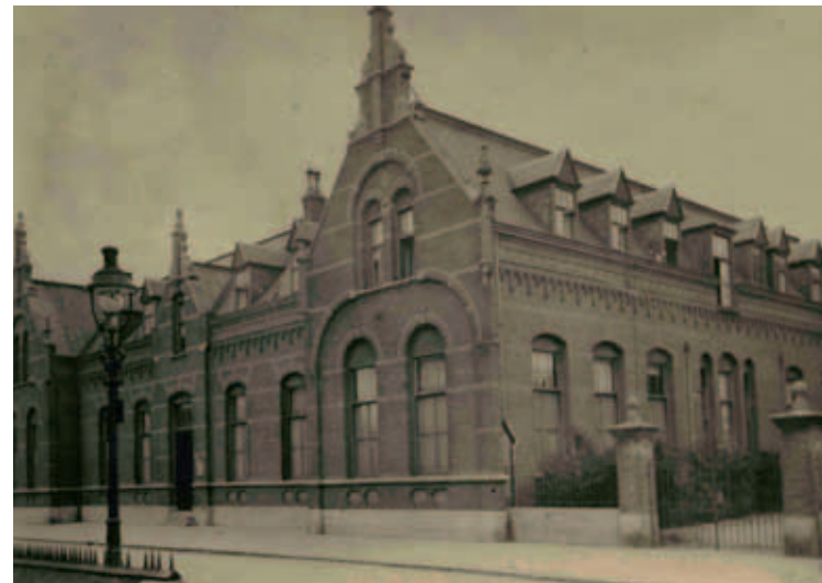
Klooster Broeders van Maastricht Molenstraat 160 in Helmond

aanleg, uitbreiding en onderhoud van de vliegvelden bij Eindhoven en Volkel. Op de 11e juni van datzelfde jaar vorderde de Ortskommandant voor het Soko Fähre een opslagruimte van 1848 m 2 van de firma de Wit aan de Hoogeindschestraat 49. Op 25 juli werd de vordering ten behoeve van Soko Fähre uitgebreid met 600 m 2 opslagruimte aan de Groenewoud van de firma Van Vlissingen Katoen. Materialen opgeslagen in dit depot werden met binnenvaartschepen aangevoerd die door