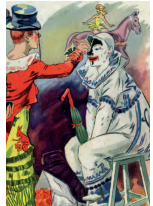
De bonte droom van het circus. Een clown is een komisch figuur die is voortgekomen uit het klassieke Romeinse theater. In de loop van de achttiende eeuw werd de clown populair in het circus.

Jacona viel bij het publiek zeer in de smaak. Het aantal optredens groeide en de benodigde attributen groeiden gestaag