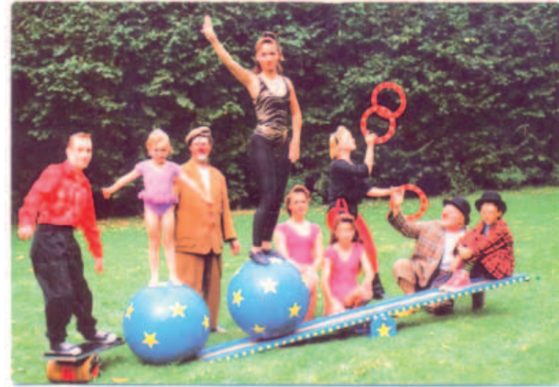
Jacona promotiekaart uit begin jaren zeventig.

Nog steeds beschikt Jacona niet over een circustent, maar dat is ook niet de bedoeling. Wel is een definitief onderdak gevonden. Dat was ook hard nodig, want het gezelschap bestaat momenteel uit ruim 30 artiesten, tal van leerlingen en meerdere hulpkrachten. In de Uilenburcht staat een piste ter beschikking waarin wordt getraind en (kinder)voorstellingen worden gegeven. Maar het hooggeëerd publiek geniet op locatie van de echte circusacts. Ondanks de capriolen zijn daarbij nog nooit zware blessures voorgevallen.