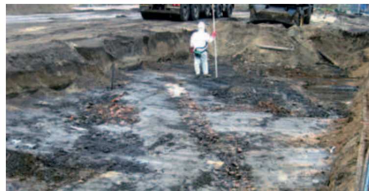
De aangetroffen fundering die ongeveer was georiënteerd op de vroegere stadsgracht.

strikte saneringsvoorschriften, niet mogelijk om tijdens de uitvoering van het werk archeologische waarnemingen te doen. Het type baksteen, de steenformaten en de samenstelling van de mortel is niet onderzocht, daarom kan er geen nadere datering van het gebouw worden gegeven. De stadsarcheoloog heeft de vindplaats nog wel in ogenchouw genomen, maar deze was helaas al bedekt met een dikke zandplaat. Dit valt te betreuren. Schouwing had essentiële informatie kunnen verschaffen over de ontwikkeling en bewoning van het bewuste gebied. Een gemiste kans!