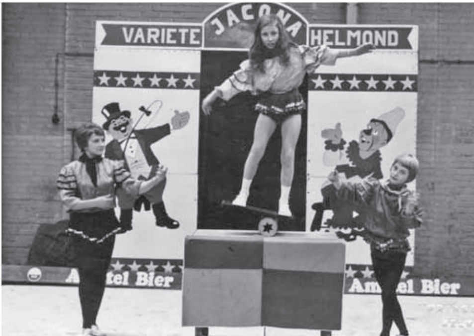
Evenwichtskunst behoort tot de vaste acts van het jeugdvariété Jacona. Ondanks de capriolen zijn er nooit zware blessures voorgevallen.

Voordat Jacona zich definitief in de Uilenburcht vestigde heeft het een lange weg begaan. In het prille begin oefende het toen nog kleine gezelschap op het Hindepleintje, zomaar in de buitenlucht. Bij regen werd doorgewerkt onder het afdak van een naburig schoolgebouw. De eerste echte thuishaven was in een school aan de Hurksestraat. Ruimtegebrek voor het almaar toenemende gezelschap noopte regelmatig tot verhuizen. Successievelijk vond men onderdak in een sociëteit achter het Theo Driessen-Instituut, in de vroegere Paterskerk, een oude kleuterschool, een buurtboerderij en in een gebouw aan de Nachtegaallaan. Vaak moest de huisvesting worden aangepast, maar de gemeente stelde zich altijd coulant op.