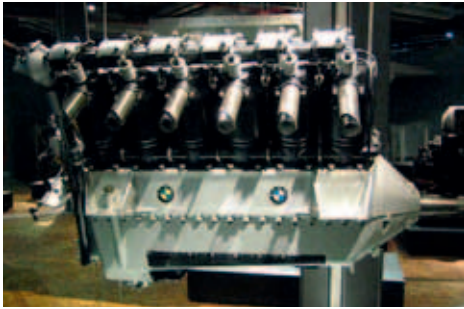
De vloeistofgekoelde BMW 6U motor. Aandrijving van de eerste veren