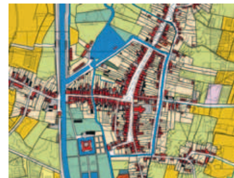
Kaartje van Helmond anno 1830 (Archeologische dienst Helmond)

Heemkundekring Helmont heeft bij het Archeologisch Centrum melding gemaakt van deze toevalsvondst. Het gebied staat echter niet op de gemeentelijke kaart met archeologisch waardevolle gebieden. Daarnaast was het, door de