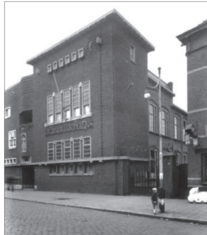
Helmond, Molenstraat, voorgevel voormalige Canisiuschool. De school werd vernoemd naar de katholieke heilige Petrus Canisius.

van Johan Canisius van vaderszijde oefenden het beroep van schoolmeester en secretaris uit. Een mogelijke voorvader, Raphaël Canisius, in 1583 schoolmeester in Arnemuiden, is ook omschreven als Raphaël de Hond.